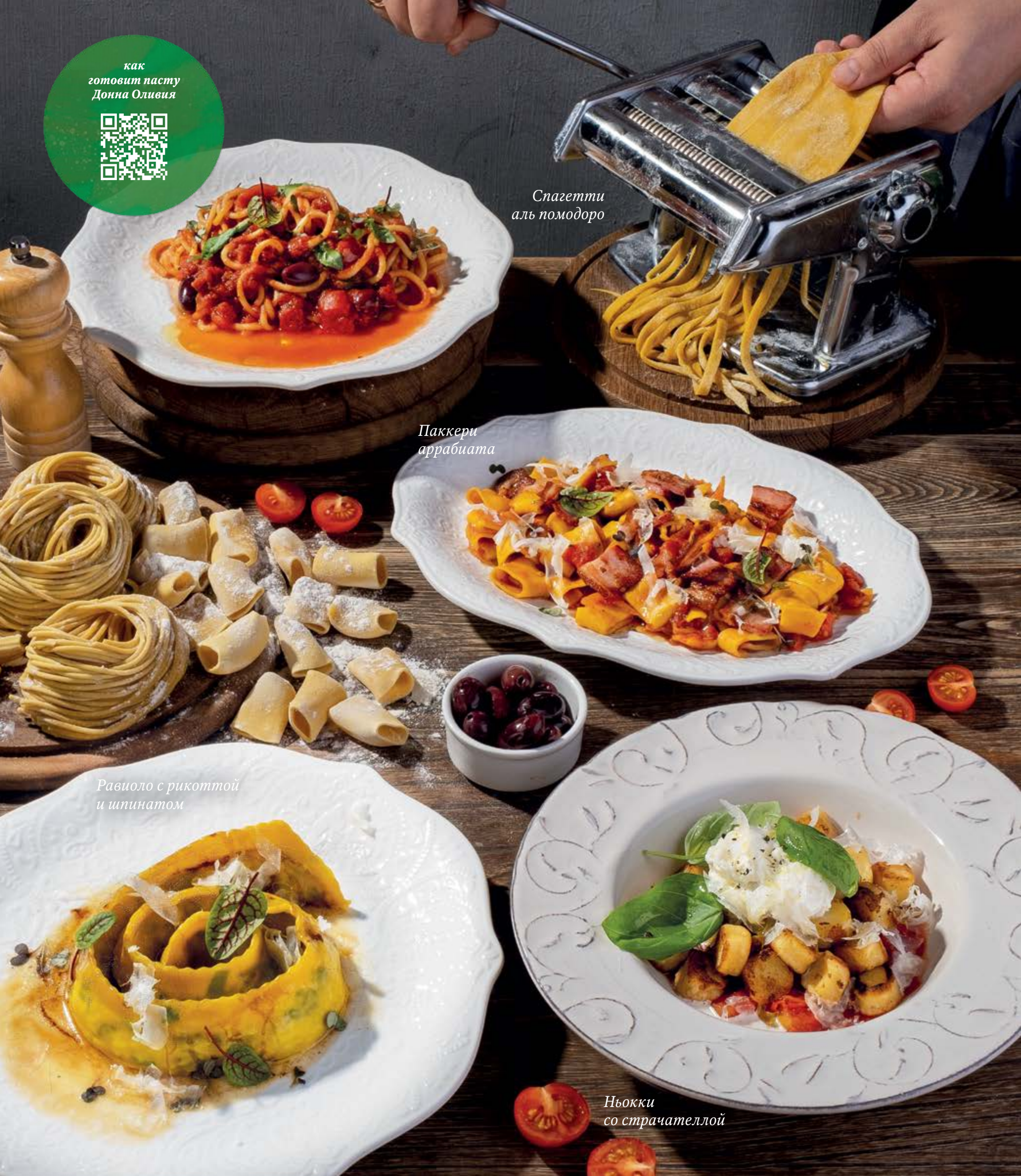
Спагетти аль помодоро