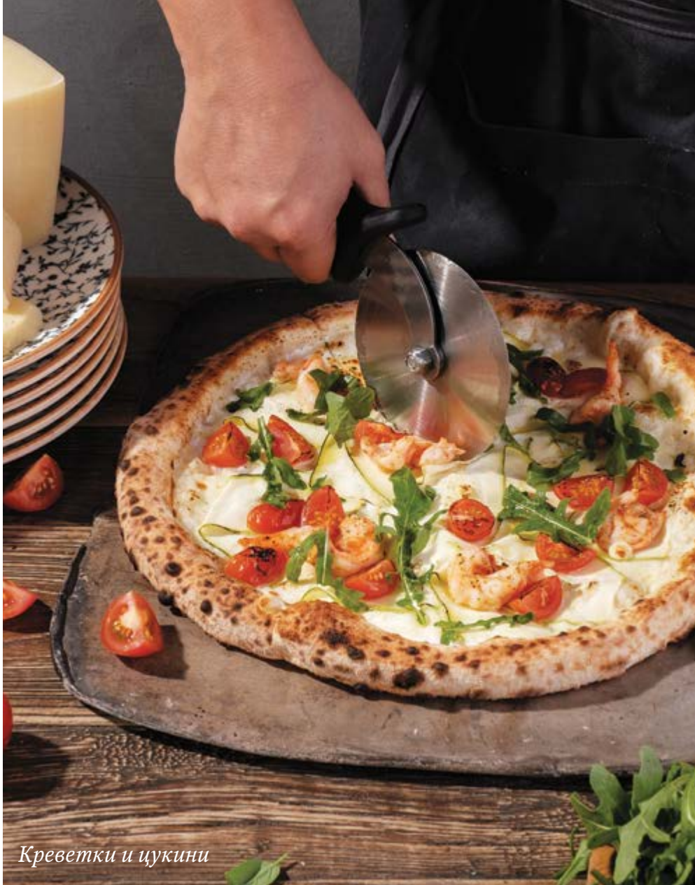
Креветки и цукини