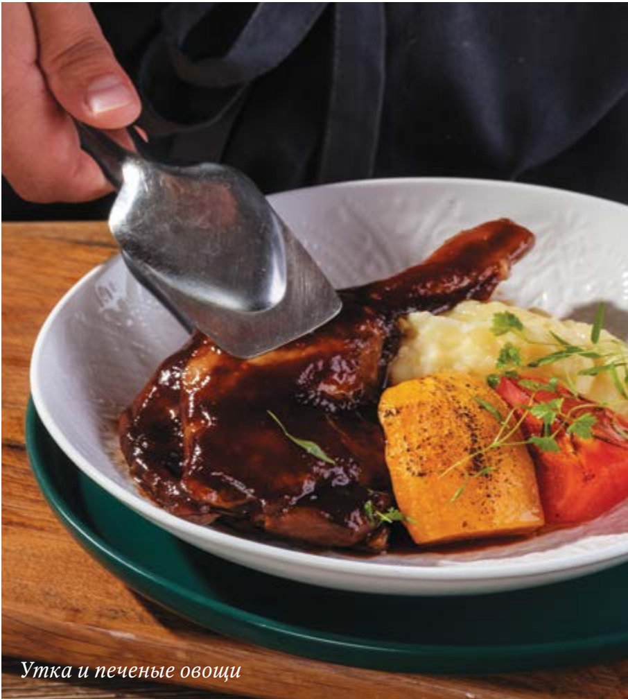
Утка и печеные овощи