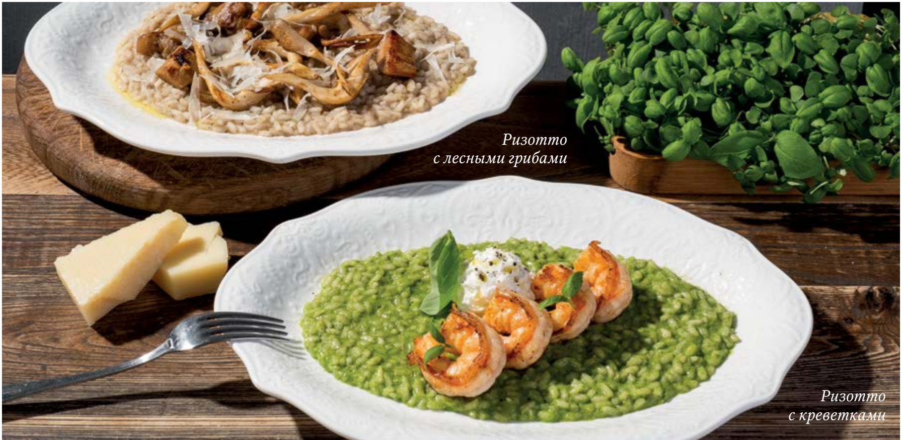
Ризотто с лесными грибами