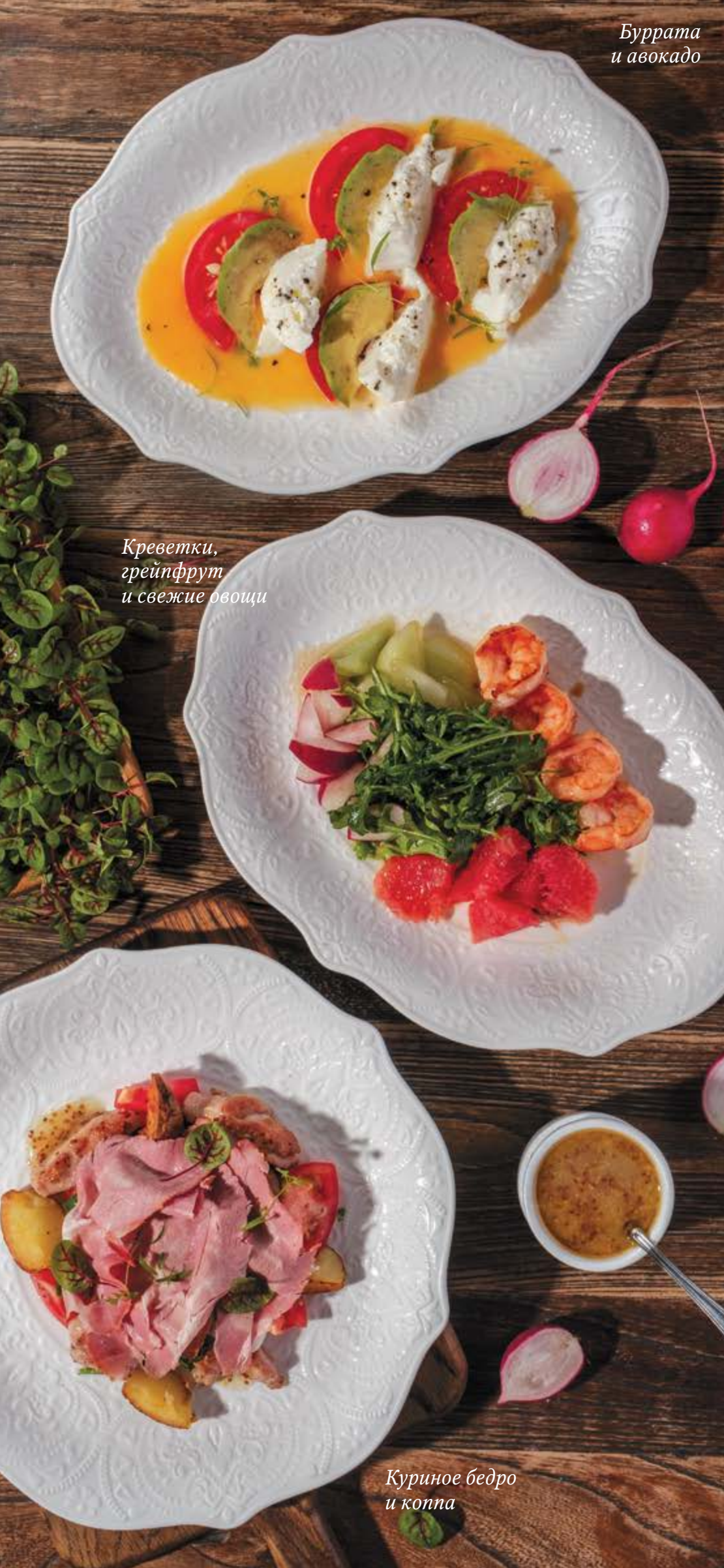
Креветки, грейпфрут и свежие овощи