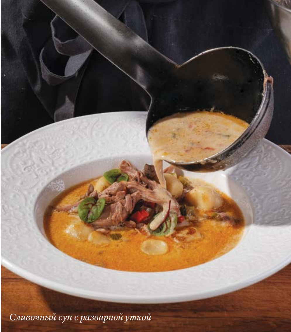
Сливочный суп с разварной уткой