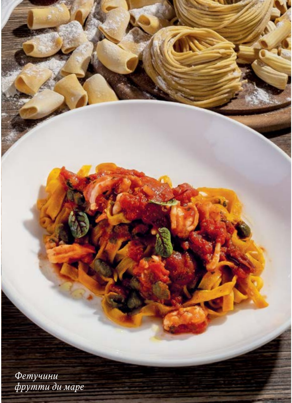
Фетучини фрутти ди mare