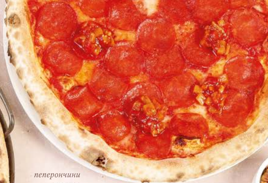
пеперончини с чоризо