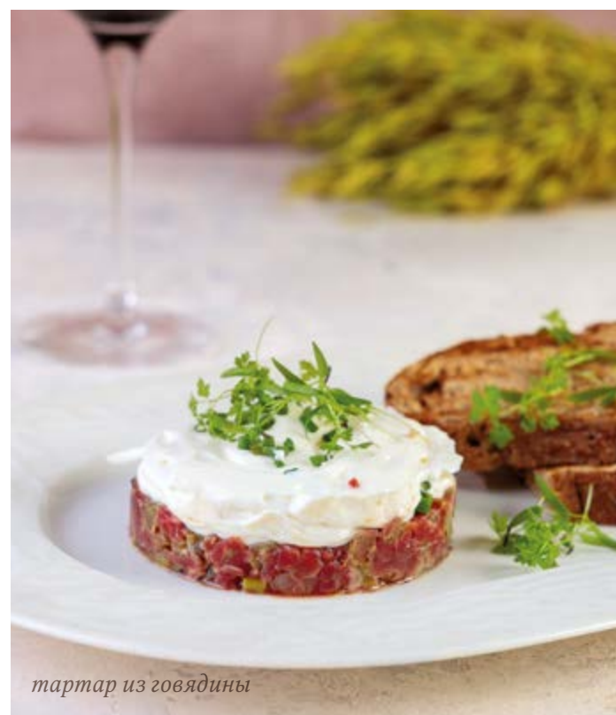
тартар из говядины