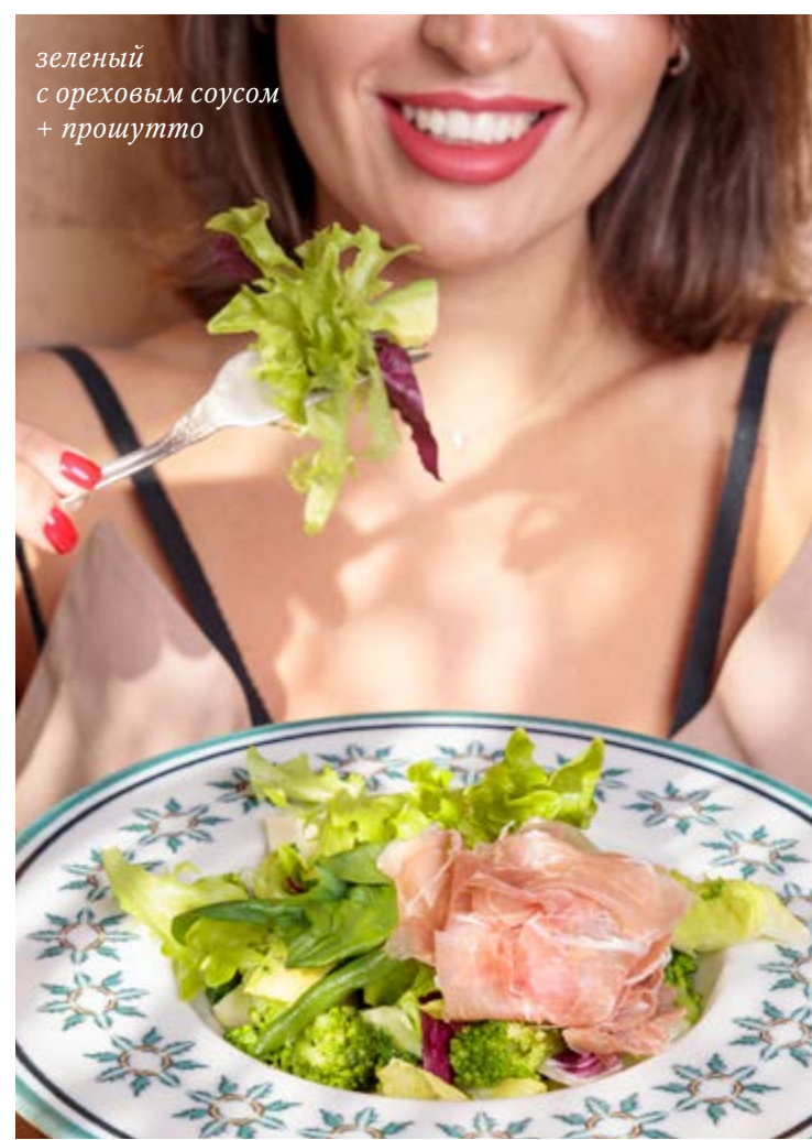
зеленый с ореховым соусом + прошутто

маринуем нежнейшую вырезку свиной шеи, чтобы получить деликатес коппу