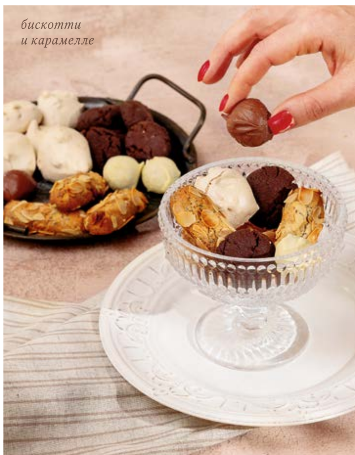
бискотти и карамелле