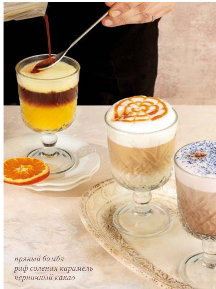
пряный бамбл раф соленая карамель черничный какао