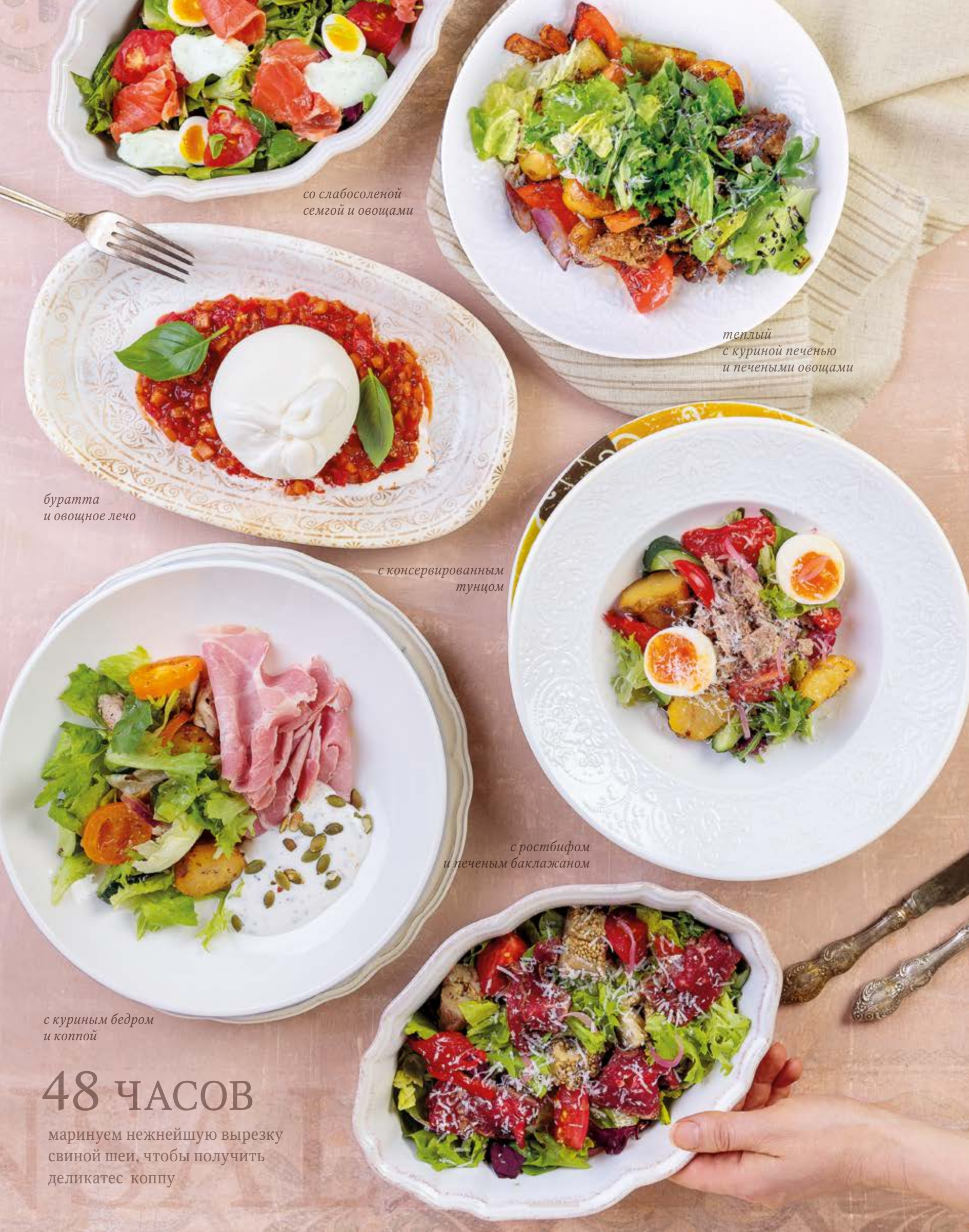
со слабосоленой семгой и овощами