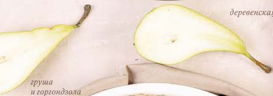
груша и горгондзола