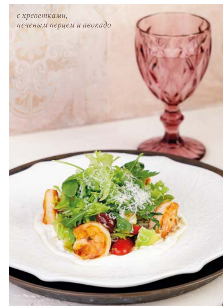
с креветками, печеным перцем и авокадо