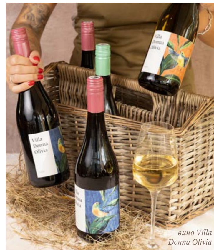
вино Villa Donna Olivia