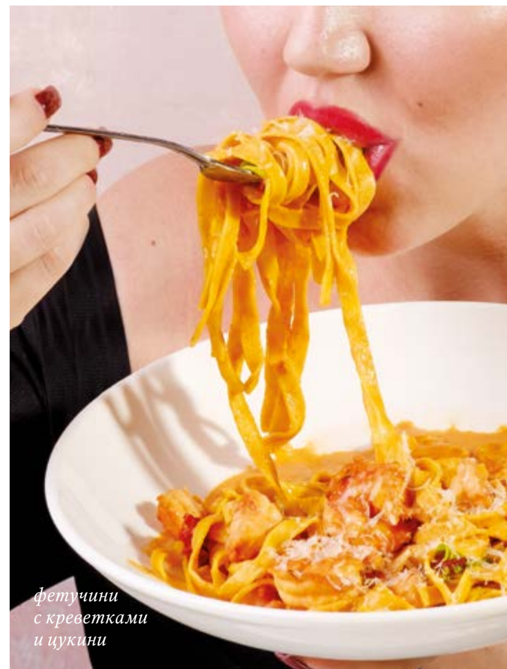
фетучини с креветками и цукини