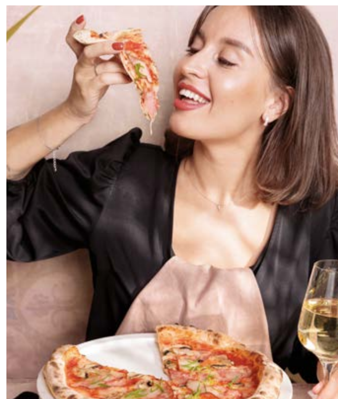
пастроми из цыпленка и листья романо